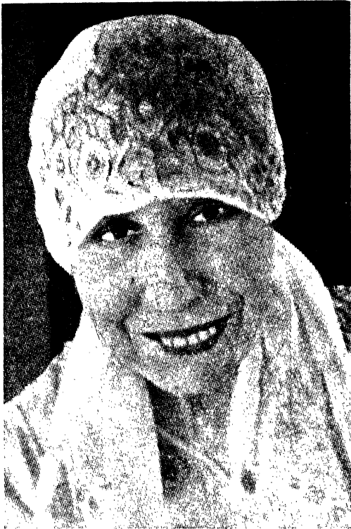
माता जी, अरविन्द आश्रम, पांडुचेरी